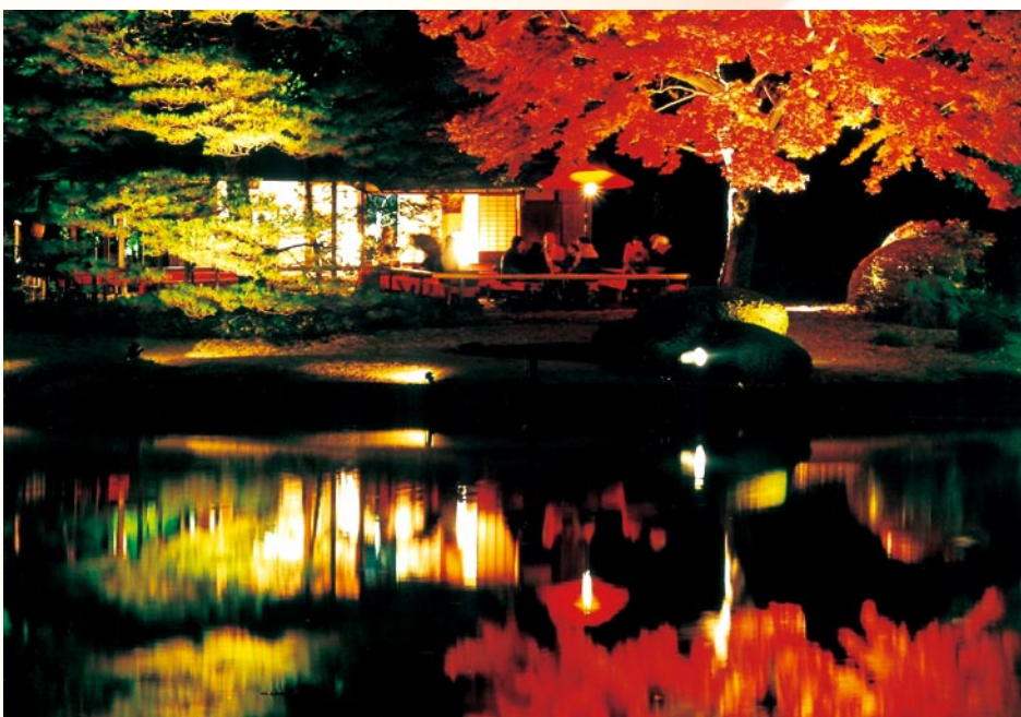
第48回文京区観光写真コンクール 推薦「名園のライトアップで一休」(六義園) 眞田武志さんの作品